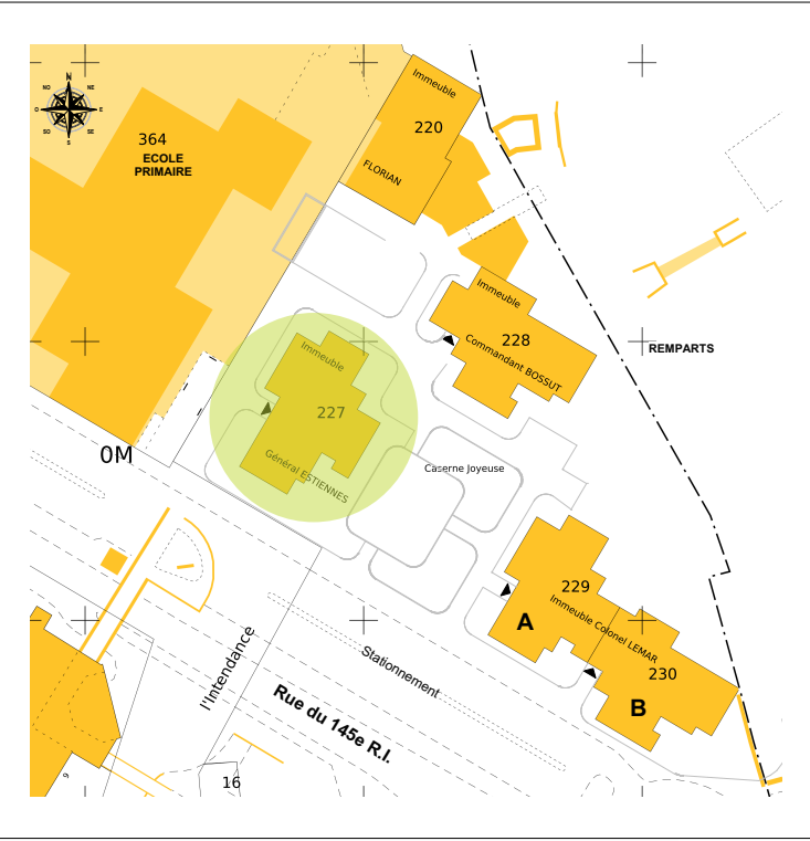
PLAN DE REPERAGE