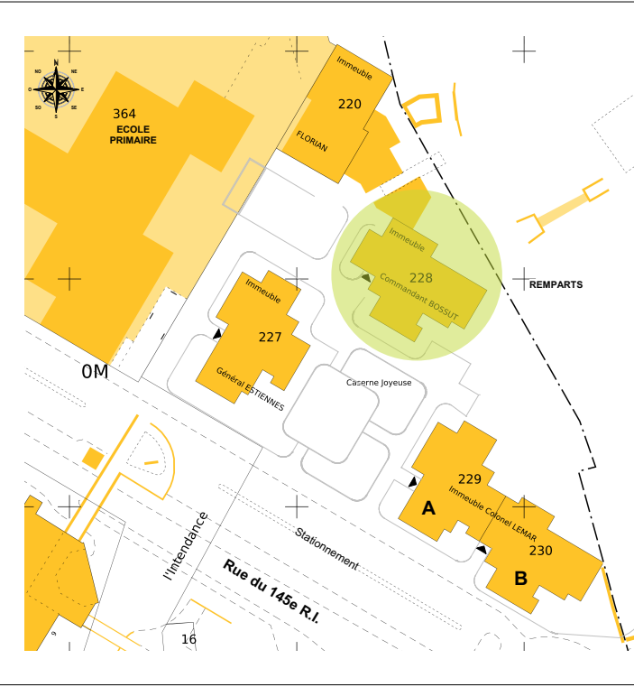
PLAN DE REPERAGE

Jean Marc THEOREZ 25, rue Pierre DUBOIS 59600 - DOUAI Tel : 03 27 87 14 00 E-Mail : jeanmarche@orange.fr